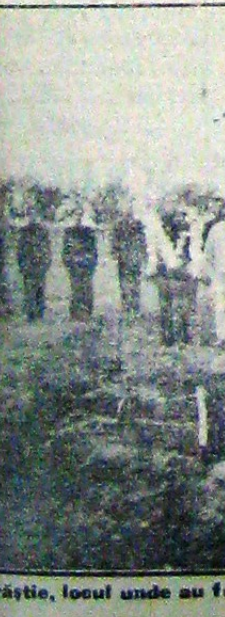
La Oraștie, locul unde au fost înhumate rămășițele pământești ale Părintelui Ion Moța.

Pentru adâncirea și lămurirea telurilor înalte, ideilor și faptelor Legionare, s'a hotărât începerea și a unei bătălii pe tărâmul cuvântului. Pentru aceea am cerut să ni se trimească din toate date asupra posibilităților locale în această privință. Anume: 1. Numărul vorbitorilor buni și bine informați în spiritul mișcării, fie legionari fie prieteni ai legionarilor din județ sau din altă localitate. 2. Publicul către care poate să vorbească, lumea intelectuală sau mase populare. 3. Numărul și mărimea săliilor de conferințe. Toate aceste date au fost cerute și se află la sfârșitul circularii No. 2. Reînnoiesc ordinul și de astă dată, să ni se trimească cât mai repede datele cerute. Trăiască Legionea și Căpitănu! Secretar general (ss) Pr. Boldeanu