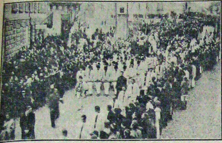
Carul funebru parcurge străzile Oraștiei

Părintele Ion Moța și-a luat locul de veci în cimitirul dela Oraștie Cum a decurs trista ceremonie a înhumării Cuvântările rostite