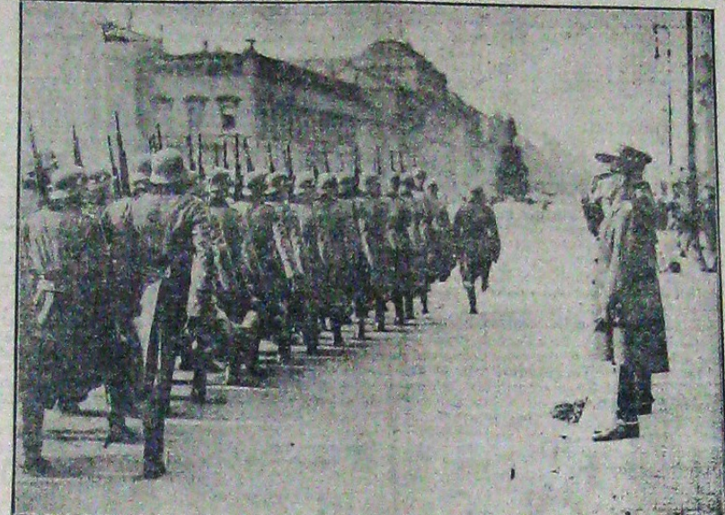
Generalul Antonescu primește în fața monumentului Soldatului necunoscut de pe Unter den Linden defilarea trupelor marelui Reich.